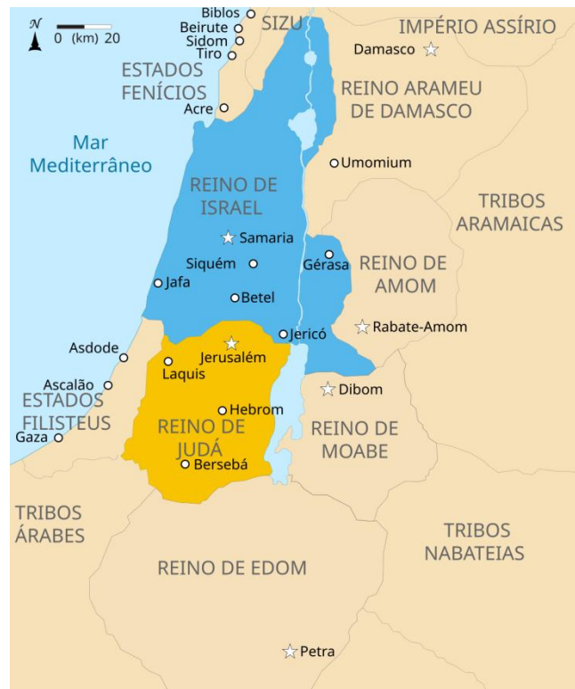
Figura 1. Mapa da região com destaque aos reinos de Judá e Israel.

No decorrer do movimento de conquista territorial e subjugação do povo, faz-se necessário considerar as relações identitárias envolvidas nos processos de integração ou na ausência destes. Os contextos de dominação promovem certo acirrar dos choques identitários experienciados pelas diferenças e embates culturais e religiosos entre o povo dominado e os babilônicos.